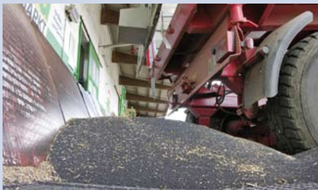
Nicht nur für Raps, auch für B-Weizen sind Prämienkontrakte möglich. Nur der Händler muss mitmachen.

Benötigt der Landwirt ein Teil des Rapsgeldes schon früher, kann er mit dem Händler auch vereinbaren, dass dieser ihm eine Abschlagszahlung zum Beispiel von 15.000 Euro gewährt. Den Rest zahlt der Händler, wenn sich der Landwirt tatsächlich zum Verkauf entscheidet. Wichtig ist, dass Landwirt S. mit seinem Erffasser eine marktadäquate Prämie vereinbart. Ist sie zu niedrig, erhält er unter Umständen weniger Geld pro Tonne Raps als wenn er nach klassischer Strategie verkauft hätte. Beispiel: Hat Landwirt S. eine Prämie von 40 Euro/t vereinbart, erhält er im Oktober nur 350 Euro/t. Sein Nachbar dagegen hatte gewartet und konnte eine bessere Prämie aushandeln, da zu diesem Zeitpunkt die Händler in der Region Raps händleringend suchten. Aufgrund der regionalen Knappheit boten die Händler sogar bis zu 370 Euro/t frei Erfasser. Die Prämie ist daher auf 20 Euro/t angestiegen, denn an der Börse lag der Preis bei 390 Euro/t. Wer als Landwirt über Prämienkontrakte vermarktet, hat neben der allgemeinen Vermarktungsentscheidung auch die Prämie und das hiermit verbundene Prämienrisiko zu berücksichtigen. Zudem sollte der Landwirt einen Eigentumsvorbehalt vereinbaren, wenn er die Ware schon frühzeitig liefert, den Abrechnungspreis aber noch offen lässt. Dies bietet Schutz, falls der Händler in dieser Zeit insolvent gehen sollte.